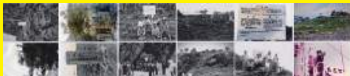
絵 は が き

中国台湾作成の地図は 尖閣は琉球群島に属し 日本領土と明記 昭和 43 年エカフエ発表で 突如領有権主張に転じ 略奪攻勢仕掛けてきた これに怒り 石垣市の領土標柱 琉球政府の三カ国語警告板設置などなされ 復帰前夜には「沖繩の宝 尖閣の島と海守れ」の島ぐるみ運動が巻き起こった