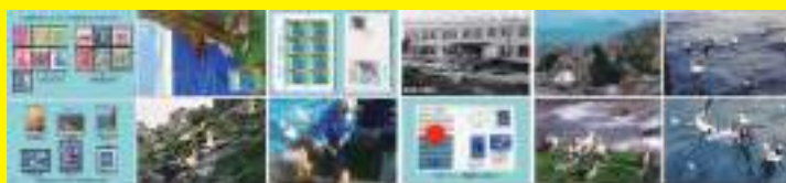
絵 は が き

戦後沖繩は米軍施政権下にあり琉球郵政庁は独自に切手発行 昭和 47 年 5 月日本復帰で閉庁 琉球郵政人の悲願は権能がある間に「尖閣切手」発行したい 秘かに「尖閣アホウドリ切手」発行を企図 隠れ裏作戦と知略で以て 日米政府の検閲を突破 復帰 1 ヶ月前 見事発行を成し遂げた